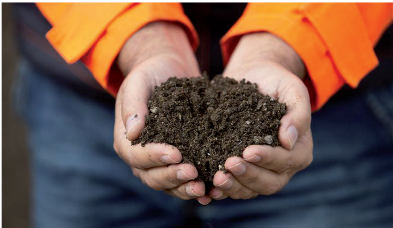
Tecnosuelos: Las zeolitas agotadas se valorizarán para la producción de tecnosuelos.