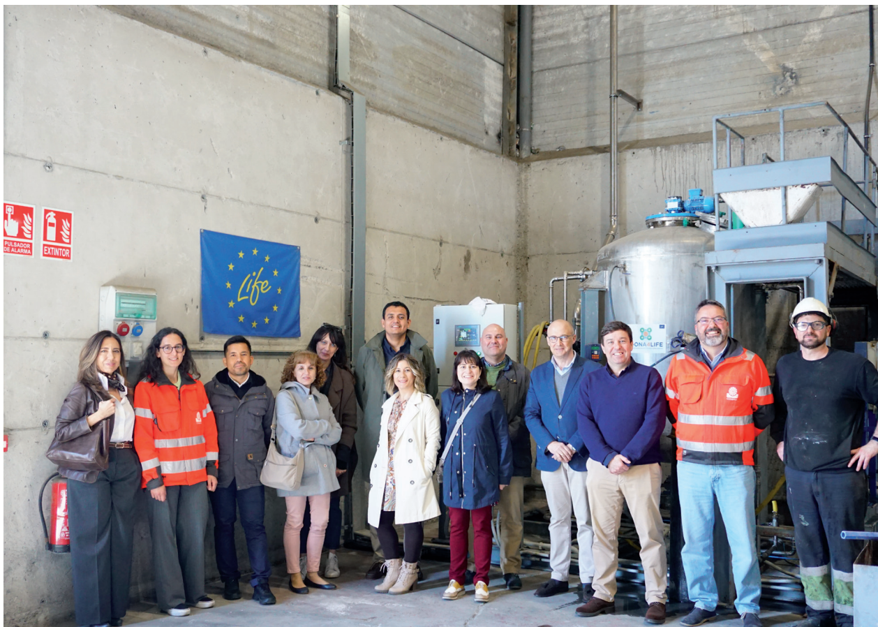
Foto de familia alusigma: El equipo de trabajo del proyecto Z-ONA4LIFE, durante la visita a Alusigma.

La producción industrializada de zeolitas artificiales ha permitido dar respuesta a la demanda creciente de este material y, además, ha favorecido el desarrollo en laboratorio de zeolitas mejoradas, más puras y con propiedades específicas para el uso deseado. Se emplean, por ejemplo, en detergentes, catálisis industrial, filtros y otros procesos químicos similares. La oportunidad de desarrollar las zeolitas Z-ONA, que son “zeolitas circulares”, surge a partir de este mercado y supone un avance muy importante en sostenibilidad. 🌈